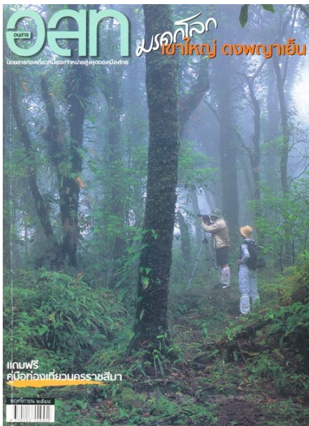
ปีที่ ๔๖ ฉบับที่ ๔ พฤศจิกายน ๒๕๕๘ มรดกโลก เขาใหญ่ ดงพญาเย็น -- เขาใหญ่ / ส่องสัตว์เขาใหญ่ / คลองปลากั้ง / ปางสีดา / ตาพระยา-ดงใหญ่ + คู่มือท่องเที่ยววนครราชสีมา