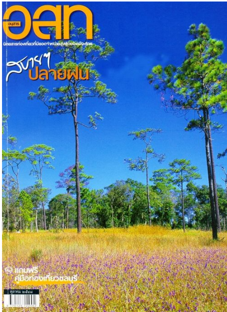
ปีที่ ๔๖ ฉบับที่ ๓ ตุลาคม ๒๕๕๘ สบาย ๆ ปลายฝน -- ตามรอยเสด็จฯ ร.๕ / ลำปาง / หุ่นนอนสน / เขาเสก / ไร่ปากช่อง / สามชุก + คู่มือท่องเที่ยวชลบุรี