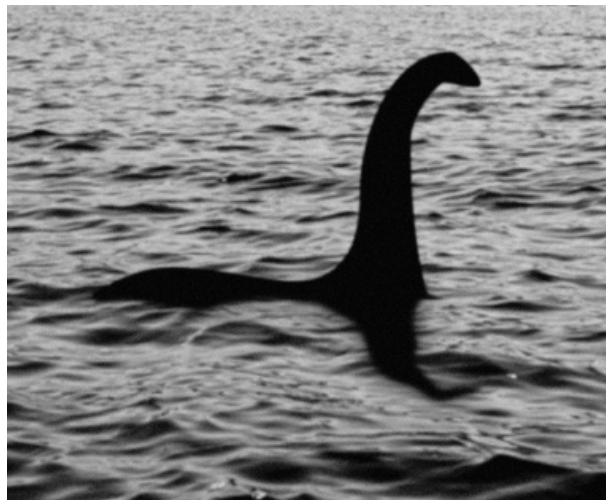
ภาพที่ 6 ภาพของ Loch Ness Monster ที่มีรายงานพบในสกอตแลนด์

เมื่อวันที่ 4 มิถุนายน 2556 ที่ผ่านมา มีรายงานพบซากปลาตาบตายอยู่บริเวณชายหาดอีสทาเวน ชายฝั่งตะวันออกของสกอตแลนด์ ทำให้ชาวอังกฤษเกิดความสงสัยว่าเป็นซากสัตว์อะไร ทำให้หลายคนจินตนาการย้อนไปถึงสัตว์ประหลาดชื่อ Loch Ness Monster หรือบางท่านคิดไกลถึงไดโนเสาร์ปลาโบราณที่หลงยุคผุดขึ้นตายทำนองนั้น (ดังภาพที่ 7)