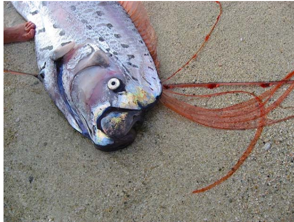
ภาพที่ 3 หน้าตาของปลาตาบ