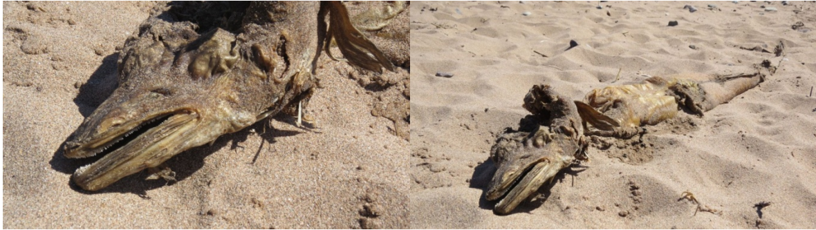
ภาพที่ 7 ซากปลาตาบที่พบบริเวณชายหาดอีساتาเวน ชายฝั่งตะวันออกของสกอตแลนด์