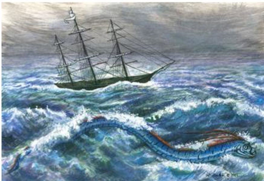
ภาพที่ 2 ปลาดาบ