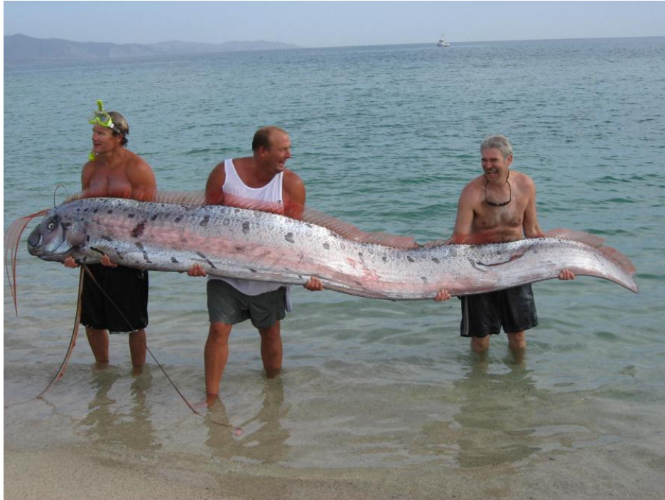
ภาพที่ 5 ลักษณะรูปร่างทั้งตัวของปลาตาบที่เคยจับได้

เมื่อวันที่ 4 มิถุนายน 2556 ที่ผ่านมา มีรายงานพบซากปลาตาบตายอยู่บริเวณชายหาดอีสทาเวน ชายฝั่งตะวันออกของสกอตแลนด์ ทำให้ชาวอังกฤษเกิดความสงสัยว่าเป็นซากสัตว์อะไร ทำให้หลายคนจินตนาการย้อนไปถึงสัตว์ประหลาดชื่อ Loch Ness Monster หรือบางท่านคิดไกลถึงไดโนเสาร์ปลาโบราณที่หลงยุคผุดขึ้นตายทำนองนั้น (ดังภาพที่ 7)