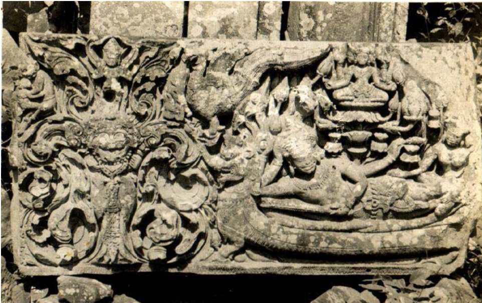
ภาพที่ 9 ภาพทับหลังรูปอนันตนาคราชผู้เป็นบัลลังก์ของพระวิษณุনারายณ์ปรมนาท ฦ เกษียณสมุทร หรือเรารู้จักในชื่อ ทับหลังนารายณ์บรรทมสินธุ์

ลักษณะของพญานาคตามความเชื่อในแต่ละภูมิภาคจะแตกต่างกันไป แต่ตามพื้นฐานทางวัฒนธรรมคือ พญานาคนั้นมีลักษณะตัวเป็นงูตัวใหญ่ มีหงอนสีทอง และตาสีแดง เกล็ดเหมือนปลา มีหลายสีแตกต่างกันไปตามบารมี บ้างก็มีสีเขียว บ้างก็มีสีดำ หรือบ้างก็มี 7 สี และที่สำคัญคือนาคตระกูลธรรมดาจะมีเศียรเดียว แต่ตระกูลที่สูงขึ้นไปนั้นจะมีสามเศียร ห้าเศียร เจ็ดเศียร และเก้าเศียร นาคกลุ่มนี้จะสืบเชื้อสายมาจากพญาเศษนาคราช (อนันตนาคราช) ผู้เป็นบัลลังก์ของพระวิษณุনারายณ์ปรมนาท ฦ เกษียณสมุทร อนันตนาคราช นั้นเล่ากันว่ามียักษ์ใหญ่โตมโหฬารที่มีความยาวไม่สิ้นสุด มีพันศีรษะ พญานาคนั้นมีทั้งเกิดในน้ำและบนบก เกิดจากครรภ์และจากไข่ มีอิทธิฤทธิ์สามารถบันดาลให้เกิดคุณและโทษได้ นาคนั้นมักจะแปลงร่างเป็นมนุษย์รูปร่างสวยงาม