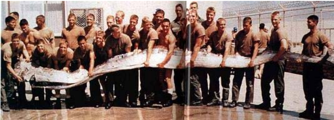
ภาพที่ 1 ภาพของปลาดาบความยาว 23 ฟุตที่ถูกจับได้โดยกลุ่มทหารเรือชาวอเมริกัน บริเวณโคโลราโด แคลิฟอร์เนีย เมื่อปี ค.ศ. 1996

หากท่านไปท่องเที่ยวในพื้นที่จังหวัดที่ตั้งอยู่ติดกับลำนํ้าโขงคงจะได้เห็นภาพที่ 1 พร้อมกับมีคำบรรยายได้ภาพว่า ปลานางพญานาคถูกจับได้ในลำนํ้าแท้จริงแล้วนั้น ‘ไม่ใช่’ แต่กลับเป็นปลาดาบ (oarfish) ซึ่งเป็นปลาทะเลลึก ไม่ได้อาศัยอยู่แหล่งน้ำจืดเช่นลำนํ้าโขง ข้อมูลที่ถูกต้องของภาพที่ 1 ดังคำบรรยายได้ภาพ