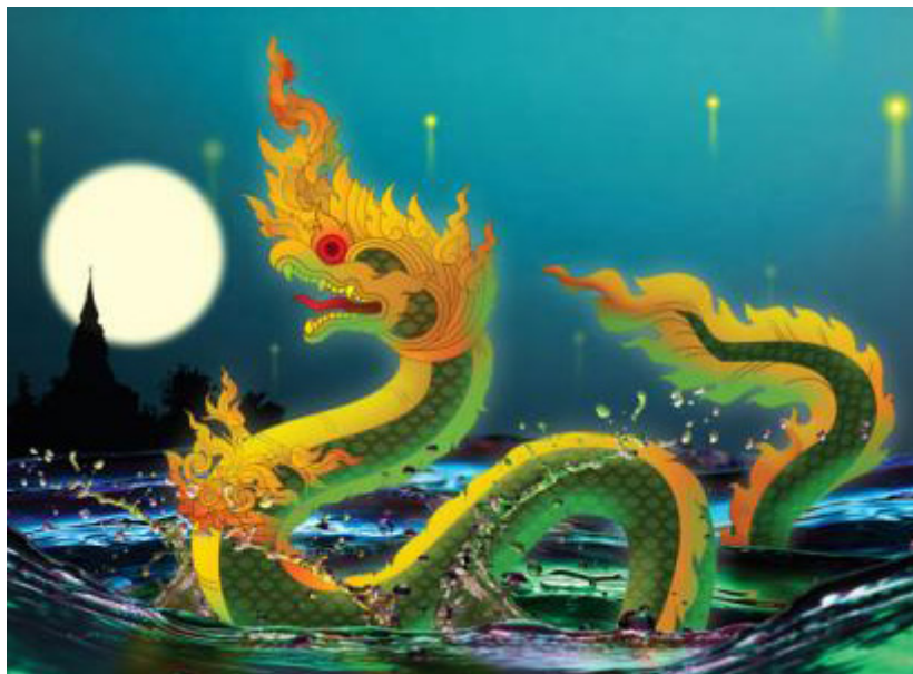
ภาพที่ 8 พญานาคตามจินตนาการของกลุ่มคนชาติพันธุ์ในลุ่มลำนน้ำโขง